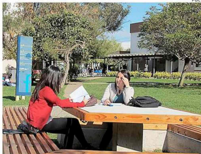
LOS ESTUDIANTES DE FILOSOFÍA TEMEN POR SU FUTURO LABORAL.